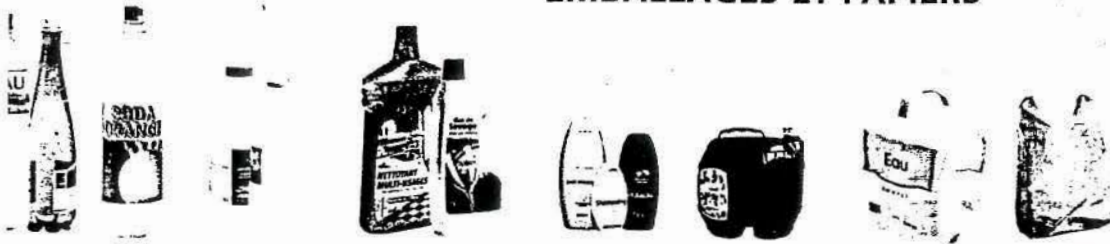
Bouteilles, flacons et bidons en plastique