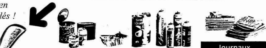
Boîtes et bidons métalliques