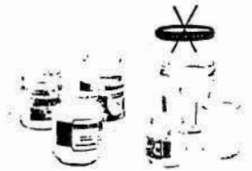
Bocaux et pots