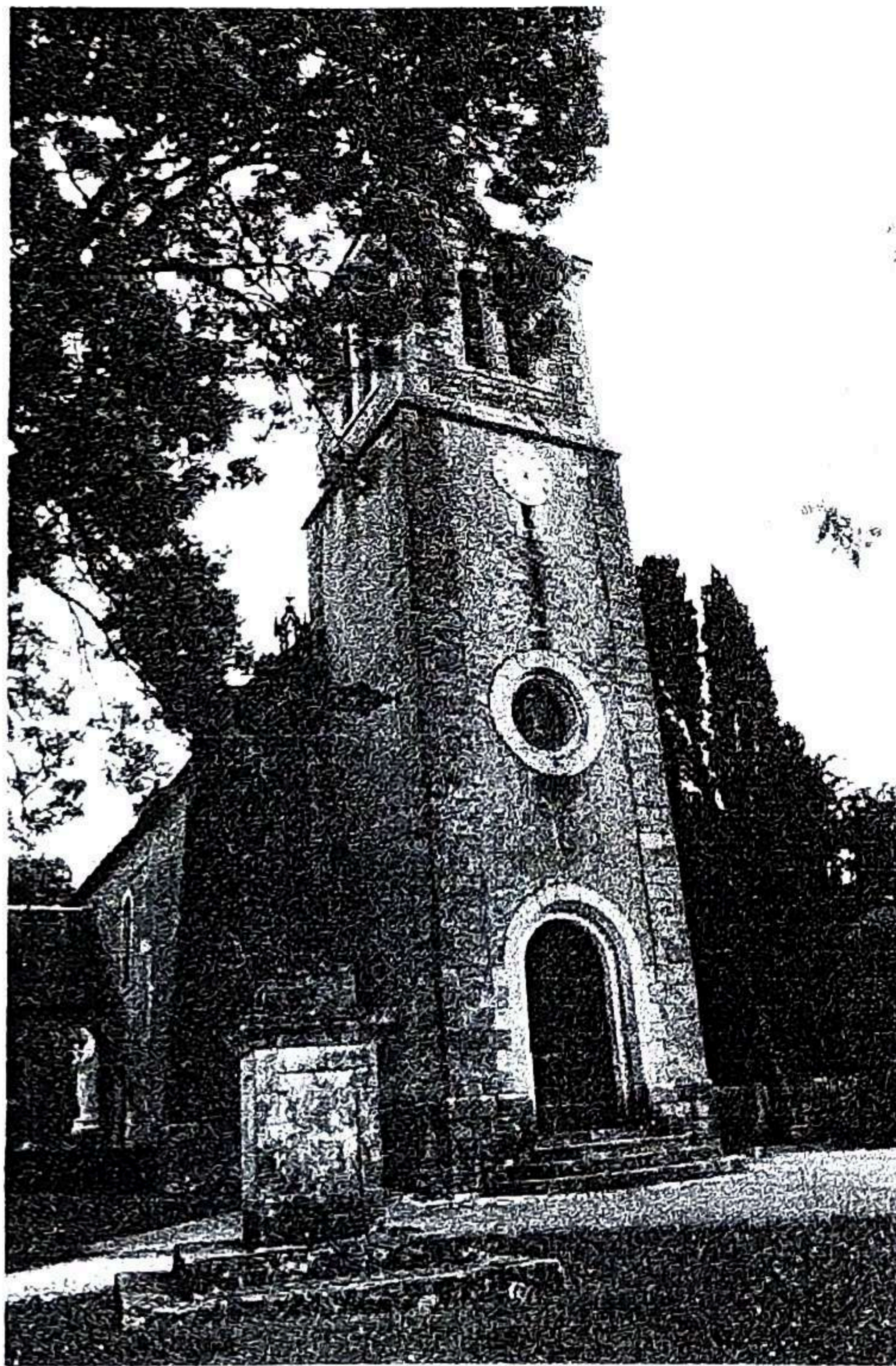
Eglise de Baladou

Bulletin municipal n° 4 commune de Baladou