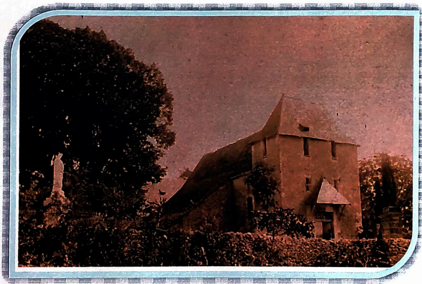
Eglise de Baladou avant 1871