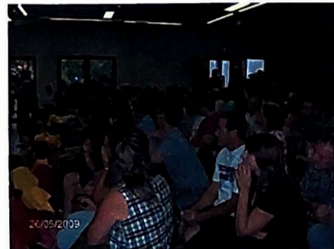
Nombreux public attentif lors des manifestations

Le bureau de l'association des parents d'élèves tient à remercier vivement les maîtresses pour leur investissement et à les féliciter pour leur première année scolaire.