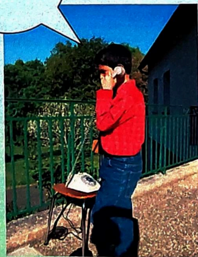
Mémento réalisé par l'école de Baladou