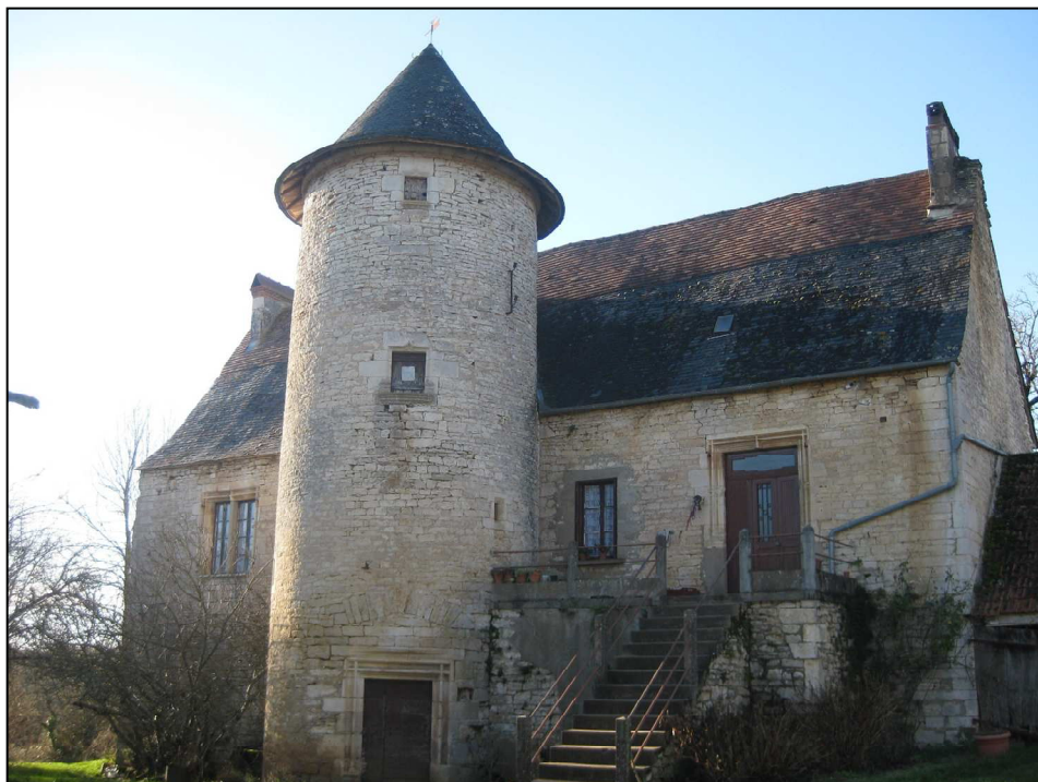
Le manoir de Chavane