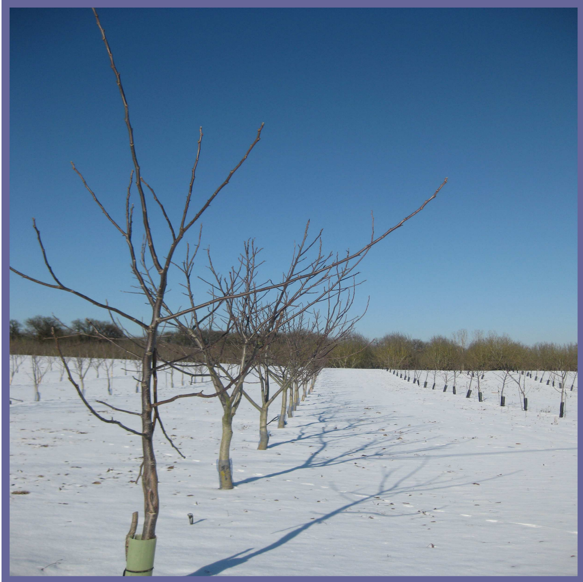
Noyers de Baladou